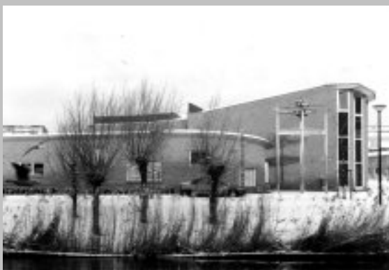
Foto : kerkcentrum "De Nieuwe Stad" Luthuliplein 11 1103 TR Amsterdam-ZO (020) 690 1458 http://surf.to/sow-bijlmer

We zijn blij dat we u deze folder met informatie over de Samen-op-Weg (SoW) gemeente Bijlmermeer kunnen aanbieden. U treft hierin een overzicht aan van de belangrijkste activiteiten binnen onze gemeente.